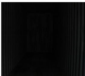
40' Container Dark

Cet appareil contient un cordon de 100' SOOW anti-explosion qui le rend idéale pour utilisation dans les zones dangereuses.